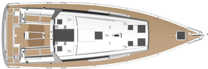
2 cabines - 2 salles d'eau