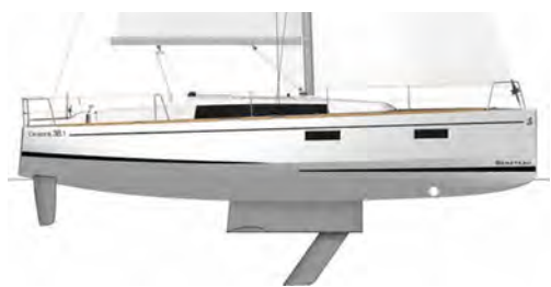
Dériveur option arceau