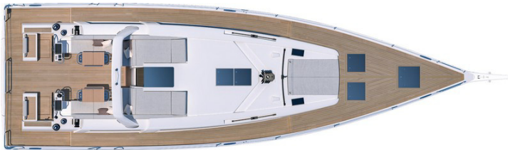
Version 3 Kabinen 2 Toiletten: