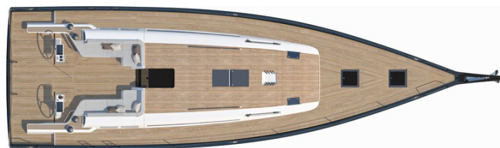
Versión 3 camarotes 2 cuartos de aseo: