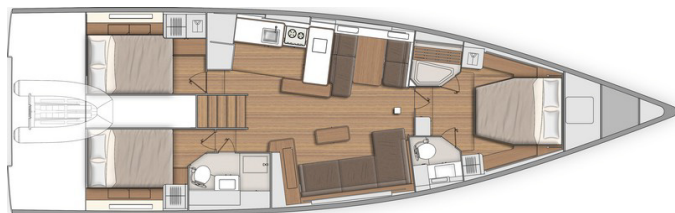
Versión 3 camarotes 3 cuartos de aseo - Camarote marinería: