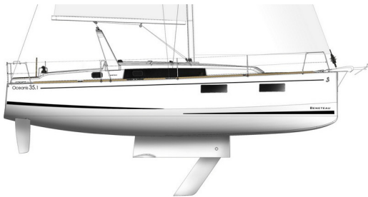
Dériveur option arceau