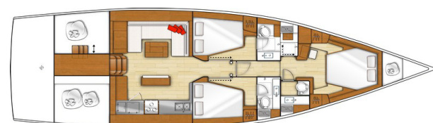
3 cabines - 3 salles d'eau