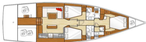
3 cabines - 3 salles d'eau