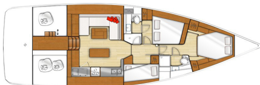
3 cabines - 2 salles d'eau