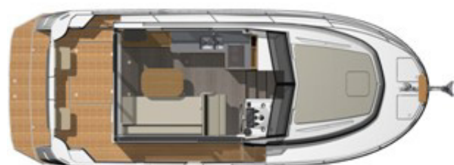
1 Cabina - Doccia separata