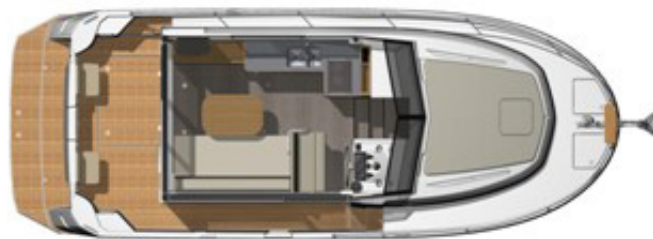
1 Kabine - Getrennte Dusche