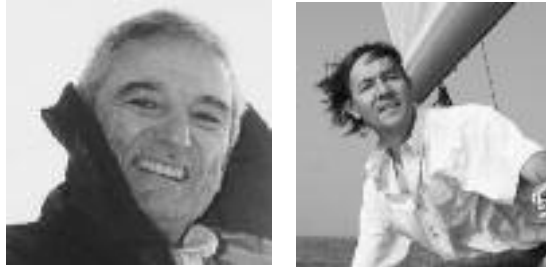
FINOT-CONQ & ASSOCIÉS

DER APFEL FÄLLT NICHT WEIT VOM STAMM. DIE KLEINEN FIRST SIND SO RASANT UND HANDLUNGSLEICHT WIE IHRE GROSSEN SCHWESTERN. SIE SIND FÜR KÜSTENTÖRNS BESTIMMT. MIT IHRER LEGENDÄREN GESCHWINDIGKEIT SCHLAGEN SIE ALLEN ANDEREN EIN SCHNIPPCHEN. SELBST IM HAFEN SIND SIE DIE ERSTEN.